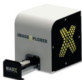
IMAGEXPLORER Sistema Manuale